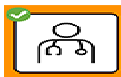
Bei Symptomen zu Hause bleiben, telefonisch Arzt konsultieren