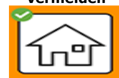
Isolation oder Quarantäne einhalten