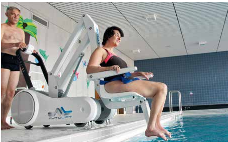
Der neue Lift im Einsatz: eine Bewohnerin auf dem Weg ins Schwimmbaden

Wenn Sie öfter das Sprungbrett lesen, wissen Sie, wie gerne die Bewohner schwimmen gehen. Nun wurde das Schulschwimmbad, das sie regelmässig besuchen, saniert. Im Zuge der Sanierung wurde der höhenverstellbare Boden entfernt und die Bewohner konnten nicht mehr ins Wasser. Was für eine Hiobsbotschaft!