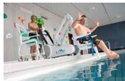
Neuer Badelift im Schwimmbad Pünt: Danke Oberrieden!